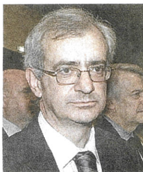
Il prefetto, Michele Tortora

La considerazione finale del Prefetto è netta e «sconsiglia l'instaurazione di un rapporto con la pubblica amministrazione» della società di cui si è chiesta l'informazione antimafia, la cui «attività d'impresa» potrebbe, «anche in maniera indiretta, agevolare le attività criminali o essere in qualche modo condizionata». La comunicazione ha portato all'emissione di una ordinanza del Comune che ha diffidato la società "Birrificio Menaggio" a lasciare i locali in quanto, questa mattina, l'amministrazione «rientrerà nel possesso e nella detenzione del bene». Sulla vicenda sono intervenuti la Cisl dei Laghi di Como e il Centro Studi Sociali contro le mafie: «Quanto accaduto a Menaggio dimostra la validità della certificazione antimafia e il ruolo fondamentale della Prefettura come ente di prevenzione. Ora il Lido sia affidato a chi risponde alle proposte e agli obblighi di responsabilità sociale».