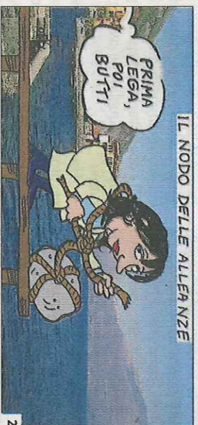
IL NODO DELLE ALLEANZE