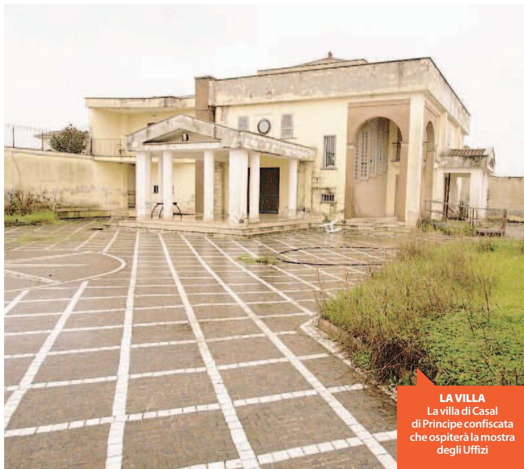
LA VILLA La villa di Casal di Principe confiscata che ospiterà la mostra degli Uffizi

I capolavori del Seicento portati nella Terra dei fuochi e nelle ville confiscate ai boss