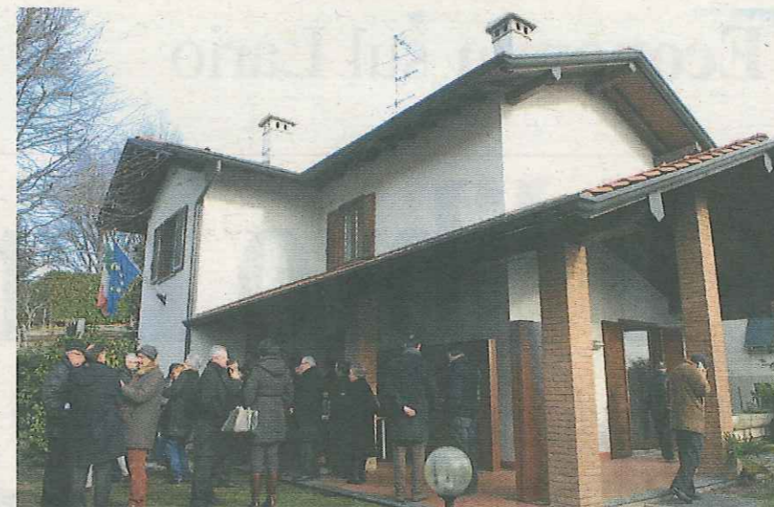
A sinistra, una fase dei lavori di ristrutturazione dei locali interni della villetta di Cermenate. Sopra, una panoramica dell'edificio sequestrato alla 'ndrangheta