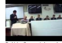
De Lisi: a Cernenate la scuola antimafia