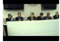
Pignatone: - sostegno al Progetto San Francesco