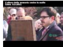
L'albero della memoria contro le mafie