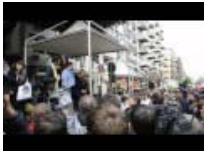
PSF all'Anniversario di Capaci