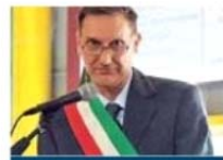
Mauro Roncoroni il primo cittadino di Cernenate, in provincia di Como