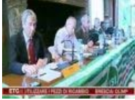
FIREWALL responsabilità e conoscenza contro il virus delle mafie