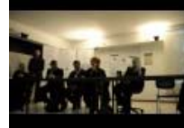
A Como Maria Falcone