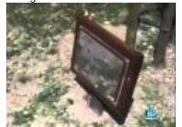
Mafia targa elv 24 5 2011