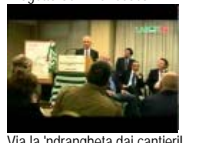
Via la 'ndrangheta dai cantieri!