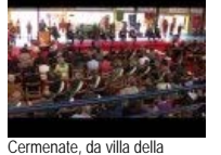
Cernenate, da villa della 'ndrangheta a centro di formazione contro le mafie