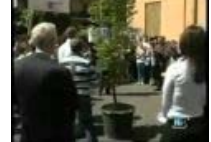
Mafia: l'albero della memoria