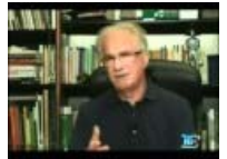
Sfregio all'ALBERO FALCONE