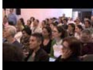
Legalità a Terrafutura