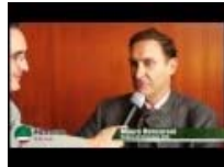
Intervista a Mauro Roncoroni - Sindaco di Cernenate