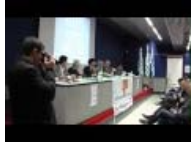
TUTTI UNO - convegno