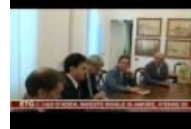
Presentato accordo ANCE-Progetto San Francesco