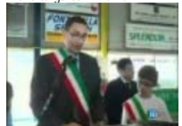
Centro Formazione Antimafia