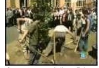
Como: spezzato l'albero Falcone