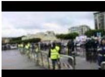
Anniversario Capaci - Le navi della Legalità