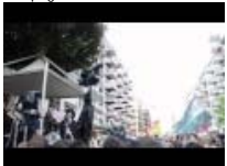
XX Anniversario di Capaci - le vittime