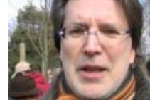
Un ulivo in memoria di Giovanni Falcone