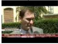
Giornata della Legalità