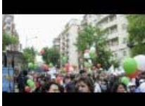
Anniversario Stage di Capaci corteo