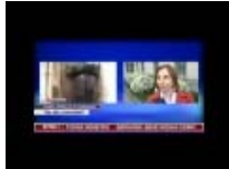
Sindaco antimafia con Cisl e Progetto San Francesco