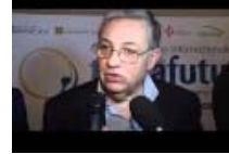
Mafia: spezzare patto di convenienza. No ai coltisi