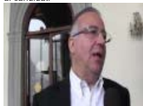
Lavoro Legalità Territorio - Convegno a Como