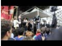
Anniversario di Capaci - La commemorazione di Piero Grasso