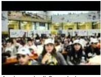
Anniversario di Capaci - La mostra nell'Aula Bunker