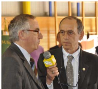
Il Procuratore Capo di Milano Bruti Liberati