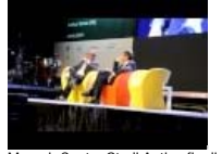
Maroni: Centro Studi Antimafia di Cernenate