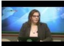
Pesenti e il Progetto San Francesco