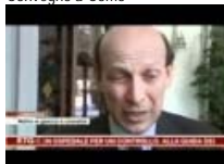
Lavoro, legalità e territorio