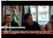
Cisl Como: 5 Proposte antimafia ai candidati