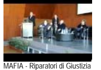
MAFIA - Riparatori di Giustizia