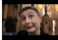
Genova sfida le mafie con il Progetto San Francesco