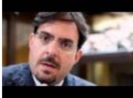
Fedeltà allo Stato, tradimento della Repubblica