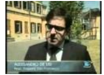
Mafia, scuola nazionale a Como sul fenomeno