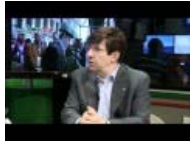
Pesenti a CislMattina: crisi edilizia e D-Day