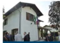
Gli esterni della villetta che apparteneva al clan 'ndranghetista dei Paviglianiti

più. Non mi fraintenda, aspetti, non voglio mancare di rispetto... Ben vengano a Cernenate le presentazioni di libri che spiegano la capacità della mafia di intaccare i sistemi politici e produttivi. Ma dopo i convegni della sera il mattino dobbiamo recuperare posizioni sul campo... Non chiedono più il pizzo alle ditte, gli 'ndranghetisti: mettono le mani sulle finanziarie che concedono crediti, e così permettendo alle fabbriche di sopravvivere e di accumulare debiti per l'eternità, delle ditte di-