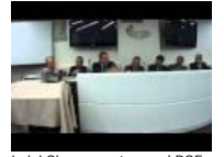
Luigi Sbarra: sostegno al PSF