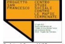
Prefetto di Como, ANCE, Progetto San Francesco