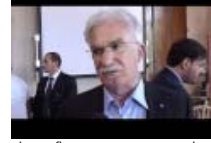
La mafia prospera su economie debilitate