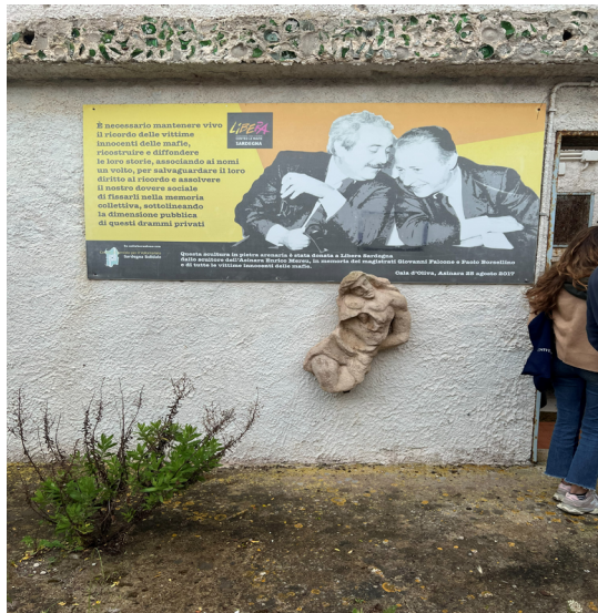
Particolare dell'interno del distaccamento carcerario "bunker" di Cala d'oliva, riservato ai boss al 41bis.