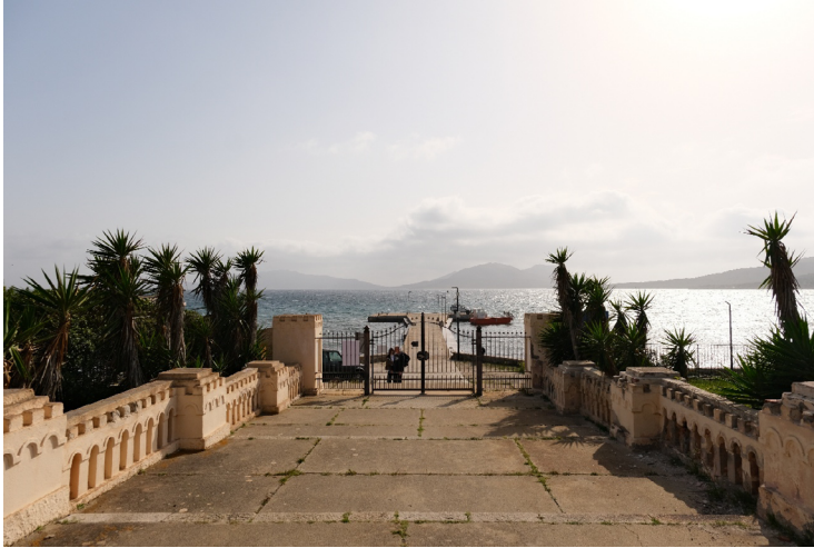
L'approdo di Cala Reale, il principale dell'isola per le navi turistiche che arrivano dalla Sardegna.