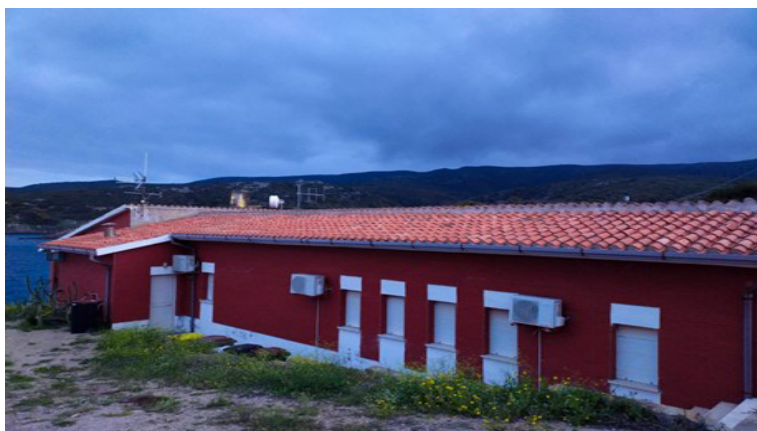
La foresteria di Cala d'Oliva ("Casa rossa") in cui trovarono alloggio Falcone e Borsellino con le loro famiglie.